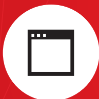
ウェブ・アプリケーション

そして・・・これまでに申し上げたように、私達は柔軟です。私達の多分野にわたって他の追随を許さない専門性を、他のプラットフォームだけでなく、.NETでもお届けいたします。