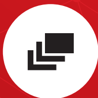
分散アプリケーション