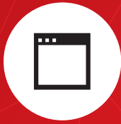
ウェブ・アプリケーション

私達の仕事は、お客様との長いお付き合いを目指すものです。透明性、安定したプロジェクト・マネジメント、そして緊密なコミュニケーションが私達のサービスの礎です。