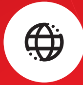
ウェブ・サービス